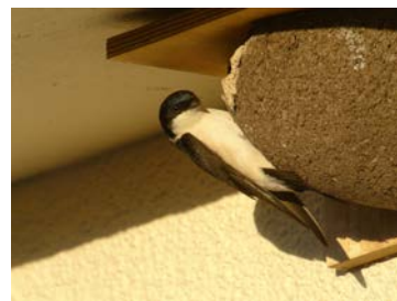
Hirondelle de fenêtre sur nichoir artificiel

La Boutique LPO propose à la vente des planchettes en bois et des nichoirs artificiels destinés à cet usage, que l'on peut retrouver sur : https://boutique.lpo.fr