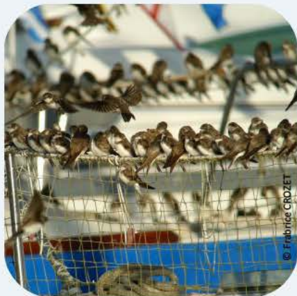
Rassemblement pré migratoire d'hirondelles de rivage

En France, les hirondelles bénéficient d'un statut de protection total issu de la loi du 10 juillet 1976 relative à la protection de la nature. Il ne peut être porté atteinte ni aux individus (poussins et adultes), ni à leur nid. Toute personne ne respectant pas cette loi s'expose à de fortes sanctions.