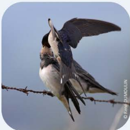
Nourrissage d'un jeune de l'année par un adulte hors du nid