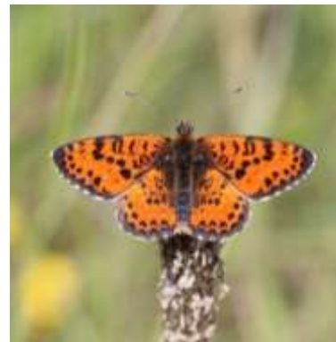
MELITEE ORANGEE Nombre total observé 307