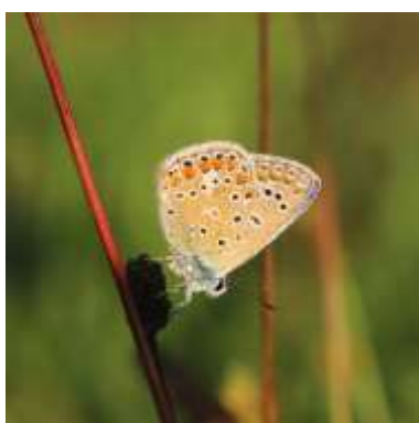
AZURE COMMUN Nombre total observé 281