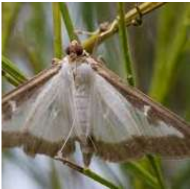
PYRALE DU BUIS