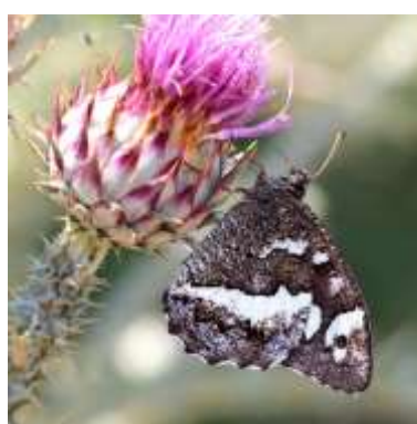
SILENE Nombre total observé 234