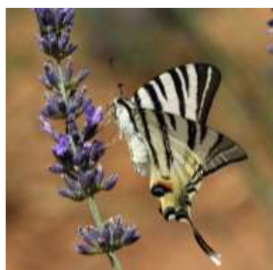
FLAMBE Nombre total observé 284