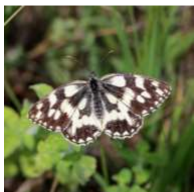
DEMI-DEUIL Nombre total observé 414