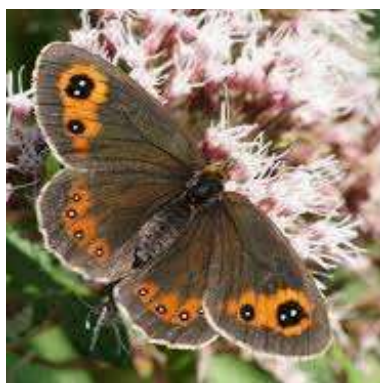
MOIRE AUTOMNAL Nombre total observé 344