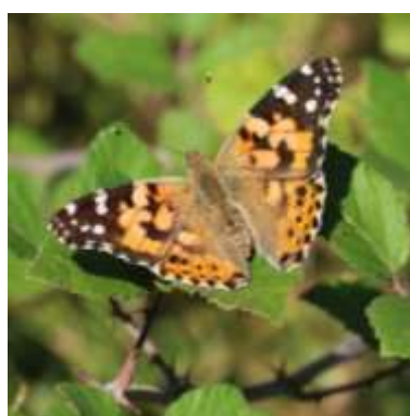
BELLE DAME Nombre total observé 414