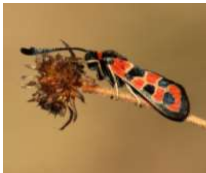
ZYGENE DE LA PETITE CORONILLE