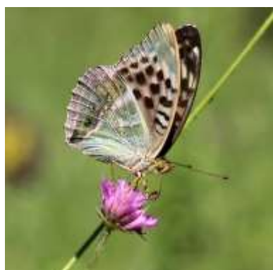
TABAC D'ESPAGNE Nombre total observé 602