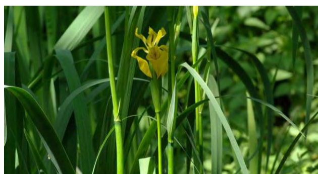
Iris des marais