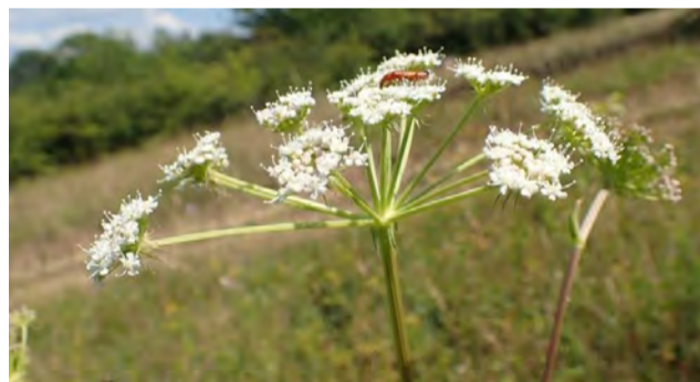
La Cervaie de rivinus

Plante hôte de la noctuelle de la myrtille